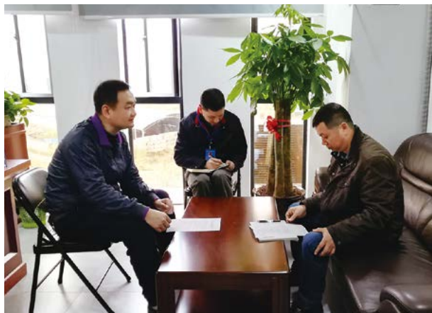
开展“扫黑除恶”专项斗争工作履职情况约谈

专项斗争工作领导小组，积极组织推进“扫黑除恶”专项斗争宣传、涉黑涉恶线索摸底排查、约谈等工作，各项工作都取得一定成效。