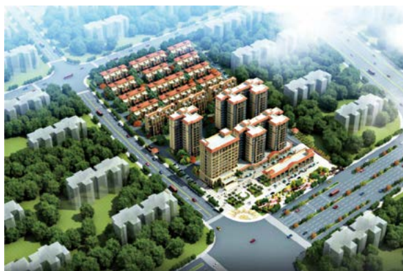
绿港·云海湾南区项目鸟瞰图

成，共357户。项目区位条件优越，交通便捷，紧靠七坡林场，西距南宁吴圩国际机场8公里，东邻良凤江国家级风景区12.5公里、大王滩风景区16公里。该项目充分利用天然环境资源，注重自然环境与人文环境的融合，遵循“以人为本，亲近自然”的设计理念，形成一个配套完善、环境优美、建筑类型丰富舒适安宁的低容积率高端住宅社区。