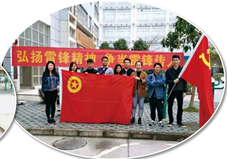
绿港集团志愿服务队员合影

9点整，活动在“学习雷锋好榜样”的歌声中正式开始，服务队向来往的人们发放“学雷锋”的宣传资料，越来越多的居民拿着破损的风扇、电脑、手机等来到服务点，维修人员们耐心地为他们检查；刚结束晨练的老人们喜欢热闹的地方，也喜欢跟青年朋友们唠唠嗑，服务队的小姑娘小伙子就帮爷爷奶奶们捶捶背，揉揉肩；在服务队里，还有一个“身怀绝技”的姑娘，她利用工作之余的时间取得了国家心理咨询师的资格，此时“免费心理咨询”牌子吸引了不少年轻人，在咨询师专业耐心的开导下，年轻人们的工作生活压力得到了一定的缓解和释放。据统计，当天共发放“学雷锋”的宣传资料40份，维修电器16台，进行心理咨询11次，提供保健服务13次。