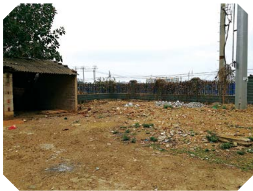
吴圩镇第二卫生院总平建设前