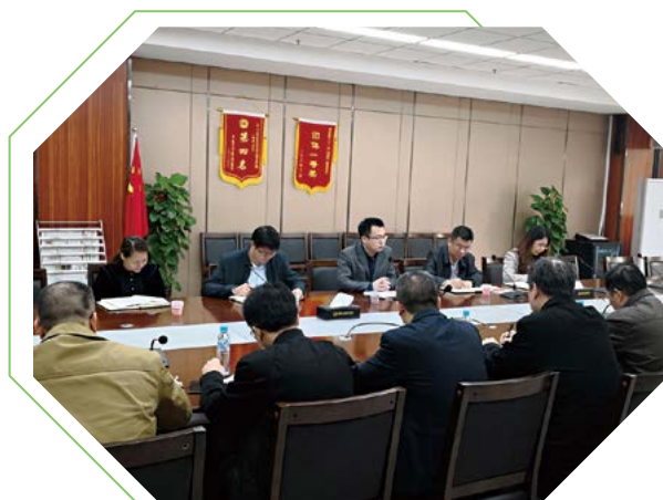
绿港集团召开“扫黑除恶”专项斗争工作部署会议

为进一步营造“扫黑除恶”专项斗争的强大声势和浓厚氛围，提高扫除黑恶势力的成效，近日，绿港集团根据经开区管委会“扫黑除恶”专项斗争相关会议精神及工作要求，在全公司范围内迅速部署开展“扫黑除恶”专项斗争工作。