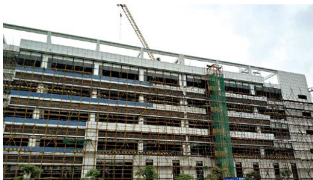
南宁空港科技产业园首批楼栋按节点拆除外架

各部门、子公司沟通交流，不断修改完善2019年攻坚项目（事项）实施方案。3月，方案经集团领导班子审议通过并下发执行，明确了吴圩镇平垌村耕地提质改造等7个重大项目、债券发行及债券兑付工作等4个重点事项、北部湾总部基地一期C区上控价编制等3个难点问题为2019年攻坚项目（事项），并要求相关部门及子公司实施克难攻坚，重点推进。