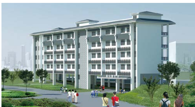
高山塘小学效果图

近期，由绿港集团下属科巨公司承建的奥园小学综合楼扩建工程、罗村小学扩建工程、高山塘小学综合楼及总平建设项目相继开工建设，将不断扩充经开区义务教育阶段学校教学班，有效地解决辖区新增居民子女入学难问题，积极化解城镇学校大班额