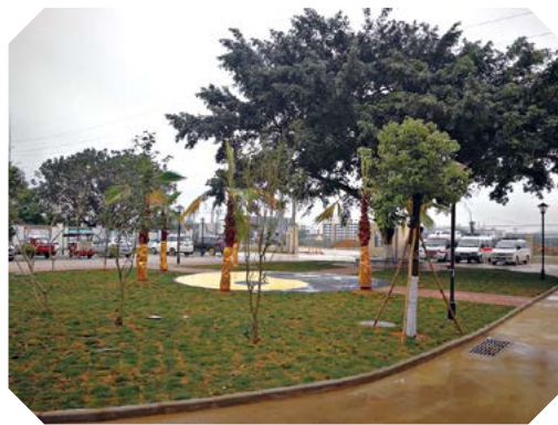
吴圩镇第二卫生院总平建设后