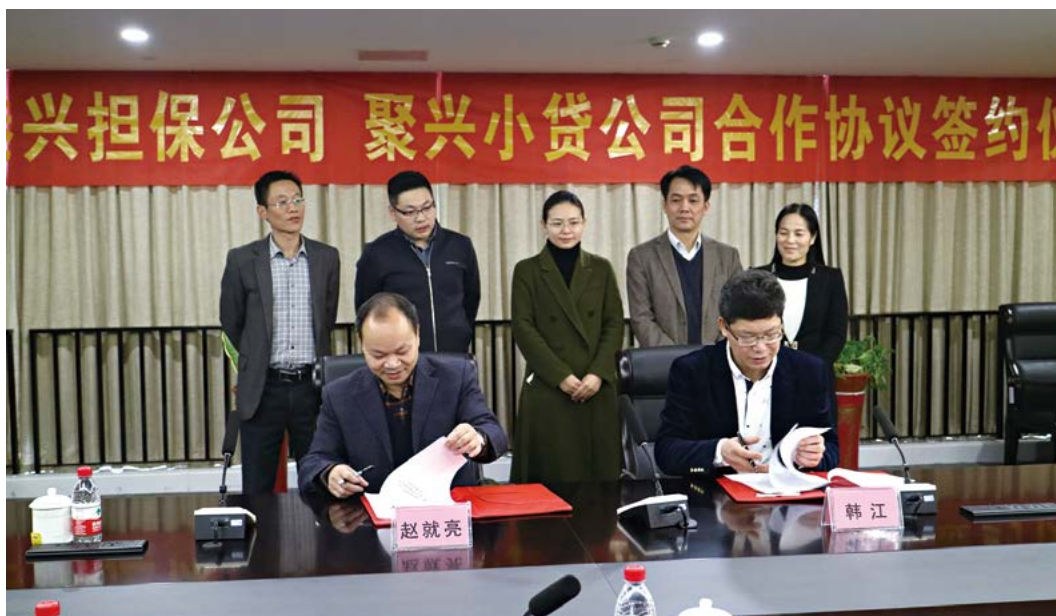
中港兴公司积极拓展资金渠道——与聚兴小贷公司签订合作协议

绿港集团成立五年来，始终牢固树立服务大局、服务企业、助力南宁经开区实体经济及新经济发展的宗旨，积极为经开区辖区内的企业提供融资担保服务，满足园区企业紧迫的融资需求，支持园区经济实现快速发展。