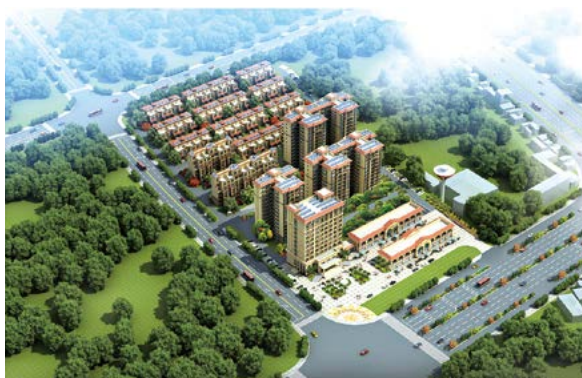
绿港·云海湾项目设计方案

将是邕城的下一个价值洼地。在整个空港开发区配套建设中，复合型交通网络是空港经济区未来的一大亮点，吴圩镇将成为空港新区的交通枢纽，未来不管是公路、地铁，甚至高铁及