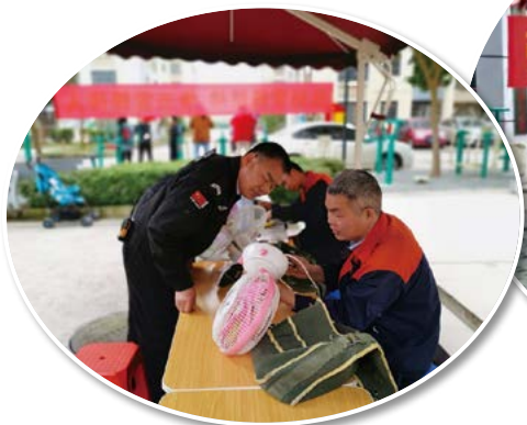
物业人员为居民维修电器