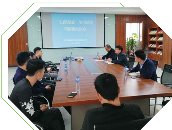
约谈项目建设工地负责人