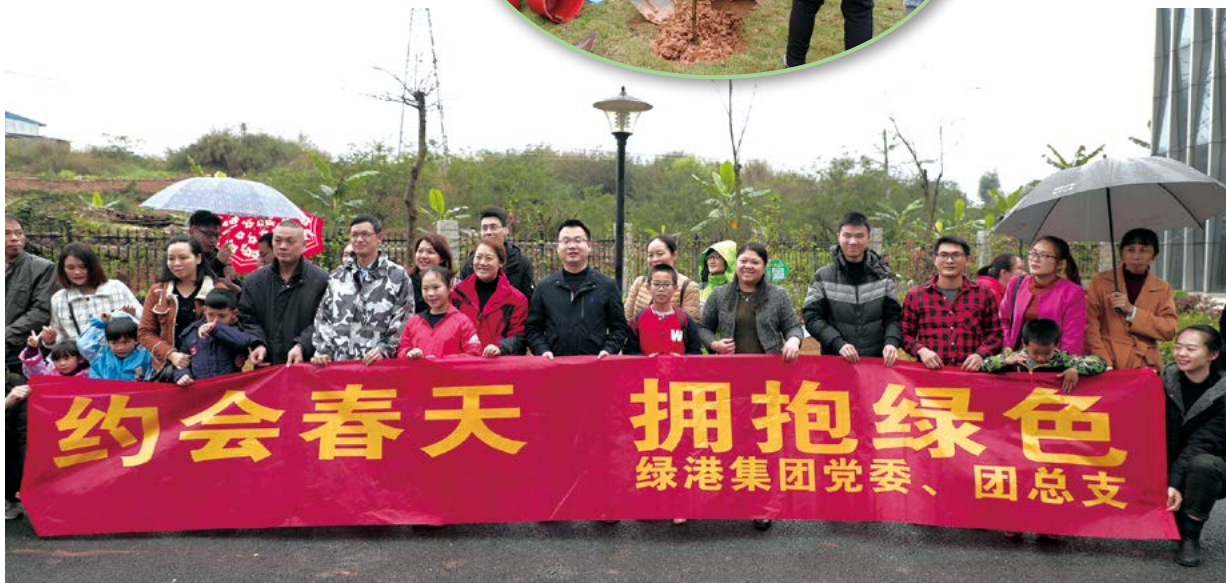
参加植树护绿行动员工合影

品、玩具、小家电、小摆设、蔬菜等各式各样物品。为了博取众人的关注，“店主们”还竖起了醒目的“招牌”，大声叫卖吆喝声此起彼伏。大家流连于各个“店铺”前，欣赏、挑选、讨价还价，兴趣盎然地参与爱心义卖活动，共享活动的乐趣。“物品有价，情义无价”，短短的两个小时，爱心物品就被爱心人士们转化为善款。