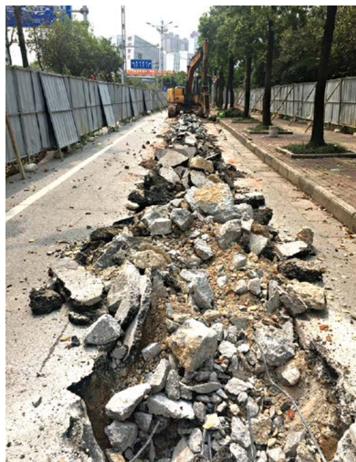
黄茅坪村委预留办公用地及产业用地场地平整工程破除混凝土

该工程起点位于黄茅坪二组、三组、五组三产回建房南侧化粪池边，由西往东敷设污水管，沿途收集二组、三组、五组化粪池出水，接入朋展路现状污水管，设计长度499米。